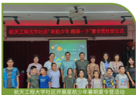
航天工程大学社区开展星航少年暑期夏令营活动

以全封闭式管理和人脸识别系统为基础,构建儿童活动安全环境。室内以多功能活动室、彩虹堂手工坊为核心,承载红色故事会、手工实践等活动;室外以小广场、亲子花园为主阵地,开展军事体验、自然探索等互动项目。