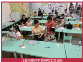
儿童观察员参加辅助志愿服务

通过带领儿童们积极开展亲子研学、探秘、文明实践等多元化活动，将“一米视角”融入社会治理，增强孩子们作为“社区小主人”的参与感和成就感，构建了成人倾听 - 儿童建言 - 积极反馈 - 共同改变的良性循环模式。