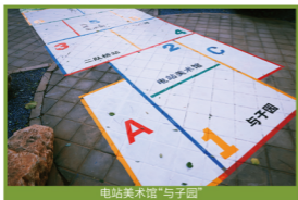
电站美术馆“与子园”