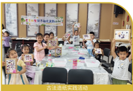
古法造纸实践活动

基础设施完善，配备幼儿园、四大学习教育阵地、首航超市、儿童健身设施及中心广场美育“微空间”，依托社区卫生服务中心、安防系统与慢行空间筑牢安全屏障。