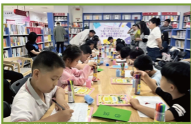
“童心悦读·健康成长”儿童心理健康主题读书活动

儿童之家设有图书阅读、儿童观影、心理咨询室等功能区,兼具活动开展与成果展示功能。以“文化大观园”为主题,打造“精品影视展”“社区嘉言堂”等五大文化品牌。