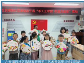
左安浦园社区携链家开展“手工艺艺术秀 邻里共绘彩”活动

社区内有体育馆路小学、现代职业学院、社区卫生服务站等优质公共服务资源，通过多元活动缓解家长压力、促进亲子关系、链接社区资源，形成儿童成长、家庭和谐、社区活力的良性循环。