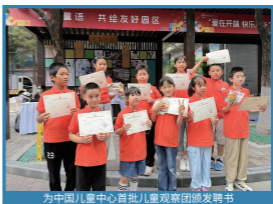
为中国儿童中心首批儿童观察团颁发聘书

长期致力于儿童参与领域专项研究，开展“一月一主题”的儿童参与活动，提高儿童观察、沟通及自我表达等方面的能力，让成员们切实参与到中心发展中，以儿童友好园区建设为切入，助力儿童友好城市建设。