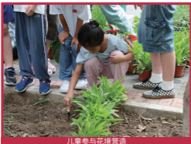
儿童参与花境营造

以“安全防护、趣味互动、认知探索”为核心，通过分层活动、场域优化与无障碍设施升级，构建全龄段儿童友好环境。