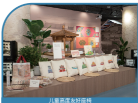
儿童高度友好座椅

聚焦城市规划和自然资源主题，依托“我们的城市”宣传计划与“少年营城”主题教育空间，构建安全、包容的儿童社会实践平台。