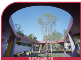
改造后的公园场景