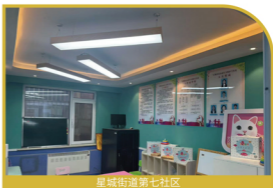
星城街道第七社区

以适儿化建设为核心，设置室内室外儿童活动空间，室内采用圆角家具、防滑地胶，划分阅读区、创意坊、亲子室等功能模块；室外设置游乐区与运动区，配备安全防护设施，为社区儿童和家庭创建了适宜友好的空间环境。