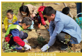
冠月季种植志愿服务

由社区妇联和社区家长学校牵头组建，以“用童眼观社区、以童心建家园”为宗旨，定期开展社区巡查和志愿服务活动。