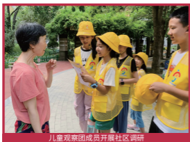
儿童观察团成员开展社区调研

以 7-14 岁儿童为主体，遵循“兴趣式组团 + 游戏式流程 + 闭环式管理”机制，围绕儿童友好城市建设、社区治理、儿童身心健康发展等三个领域近 20 个主题开展调研议事活动。