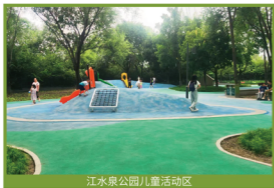
江水泉公园儿童活动区

通过多元融合打造满足各年龄段需求的儿童乐园，构建安全、有趣且富有教育意义的户外空间，促进儿童健康成长，提升公园整体品质与服务能级。