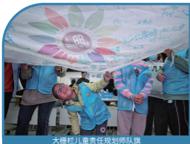
大柵栏儿童责任规划师队旗

汇聚梨园文化、京味文化与传统商业文化，集聚同仁堂、瑞蚨祥、全聚德等多项非遗项目，以中轴线为文化坐标，整合全域资源打造沉浸式成长生态，构建“儿童友好型历史文化街区”。