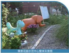
微景花园示范中心整体实景图