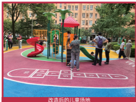
改造后的儿童场地

构建集游乐、学习、成长功能于一体的复合型儿童成长环境。采用圆角家具、软质铺装等安全设计，配备七彩滑梯、跷跷板等趣味设施，划分健步道与体育活动专区，满足儿童攀爬、跳跃等身体发展需求。