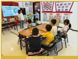
世界地球日主题活动