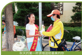
秋天的第一杯贤咖送给最美的你

通过线下议事、线上议事及线上线下结合三种方式开展活动,涵盖设施改善、活动策划、跨代互助等多领域。